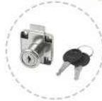
Réf : SC-ACC2