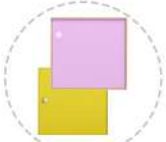
Réf : SC-ACC1

Rangement à 10 cases en bois MDF mélaminé fixé sur une structure métallique revêtu en époxy.