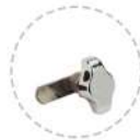
Réf : SC-ACC3