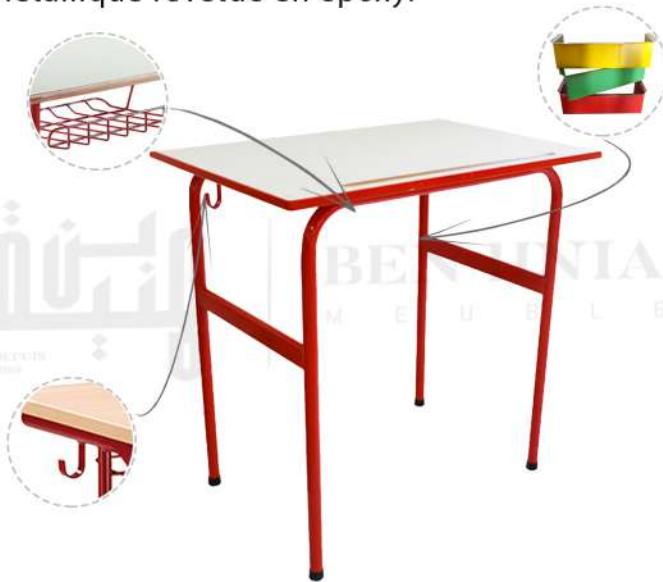
Table monoplace pour les établissements scolaires. La table est constituée d'un plateau en bois MDF mélaminé, fixé sur une structure métallique revêtue en époxy.