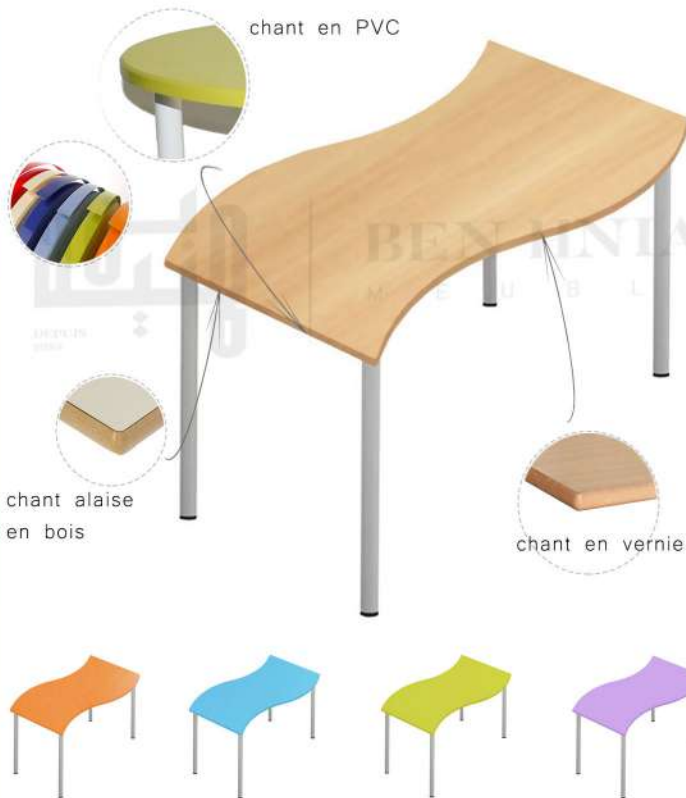
Table multiplace pour les établissements maternels. La table est constituée d'un plateau en bois MDF mélaminé, fixé sur une structure métallique revêtue en époxy basée sur 4 pieds.